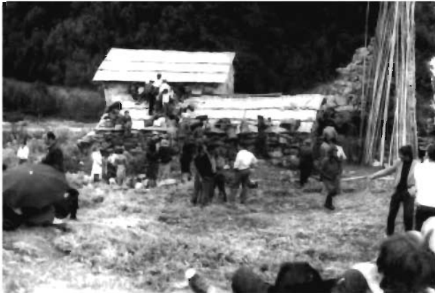
ლიჩინიშის წმ. გიორგის ეკლესია.

ქუდოსანი წმინდა გიორგის (ჯგერა ლიჩინიშ ლიფაყუ) ეკლესია, რომლის შემოგარენშიც ტარდება დღესასწაული, სოფლიდან 4 კილომეტრის დაშორებით მდებარეობს. ეკლესია XI საუკუნეშია აგებული და ჩვენამდე მცირედი დაზიანებებითაა მოღწეული. მოხატულია ოდნავ მოგვიანებით. შედარებით უკეთაა შემორჩენილი ინტერიერში სამხრეთ და ჩრდილოეთ კედლებზე შესრულებული სცენები წმინდა გიორგის ცხოვრებიდან. კედლებზე მრავლადაა გრაფიკული წარწერებიც.