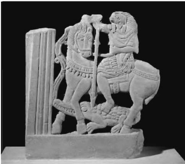
ჰორის გამოსახულება ფარასიდან (სუდანი)

ვსაუბრობთ რა ქრისტიანულ სამყაროში წმინდა გიორგის და ზოგადად წმინდა მხედრების კულტის ჩამოყალიბება – განვითარების თაობაზე, უსათუოდ უნდა ვახსენოთ ერთი მეტად საინტერესო არქეოლოგიული ნივთი, რომელიც ფარასშია (სუდანში) აღმოჩენილი. ეს გახლავთ ძველევგვიპტური ხანის რაინდი ღვთაება ჰორის გამოსახულება, რომელიც კლავს ნიანგს. (სურ. 12 - ჰორი) იგი დაცულია ლუვერში (პარიზი) და მკვლევართა მიერ დათარიღებულია ქრისტეს შემდგომ 270-350 წლებით [Bénazeth D., 1997]. როგორც სპეციალისტები მიიჩნევენ, ამ გვიანევგვიპტური კულტურის არტეფაქტში გაჟღერებულმა თემამ, თავის დროზე, წმინდა გიორგის და ზოგადად წმინდა მხედრების სახისმეტყველებითი მოდელის ჩამოყალიბებაზე, გარკვეული გავლენა მოახდინა [Bénazeth D., 1997].