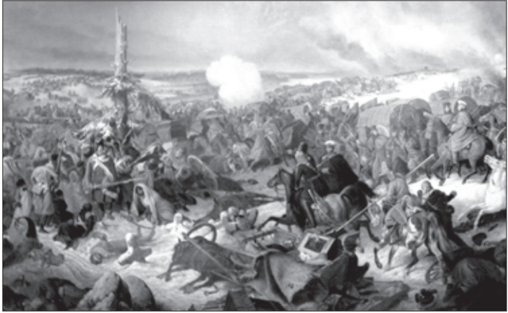
ერთ-ერთი ბრძოლის ეპიზოდი

რეში და ფონს აღარ ეძებდნენ. მაგრამ რაკი ხშირი წვიმების გამო მდინარე ადიდებული იყო, ისინი ხშირ შემთხვევაში იხრჩობოდნენ. ამ ბრძოლაში მთიელებმა დაკარგეს 325 კაცი, რუსებს მხოლო 11 ადამიანი მოუკლეს და დაუჭრეს. ჯარების ზემდეგი ვ. ი. ეფრემოვი გამოჩენილი სიმამაცისთვის დააჯილდოვეს წმ. ანას მესამე კლასის კავალერიის ჯვრით.