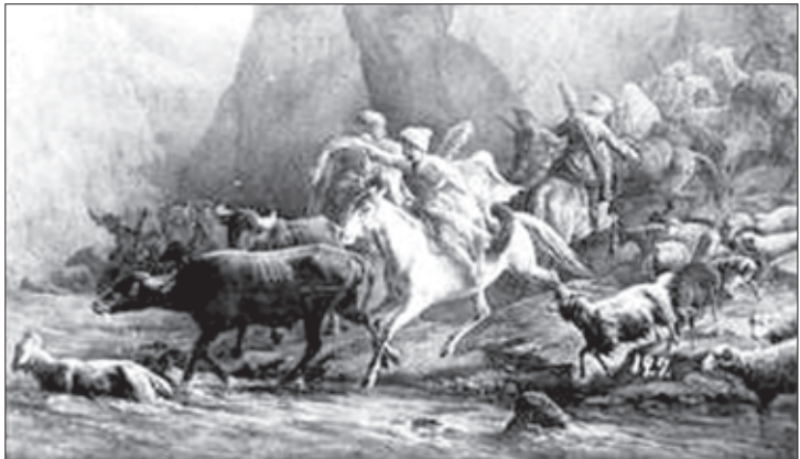
ლეკები ნადავლით ტოვებან სოფელს

შაჰ-აბასის შემოსევების შემდეგ, კახეთის აოხრებით და-