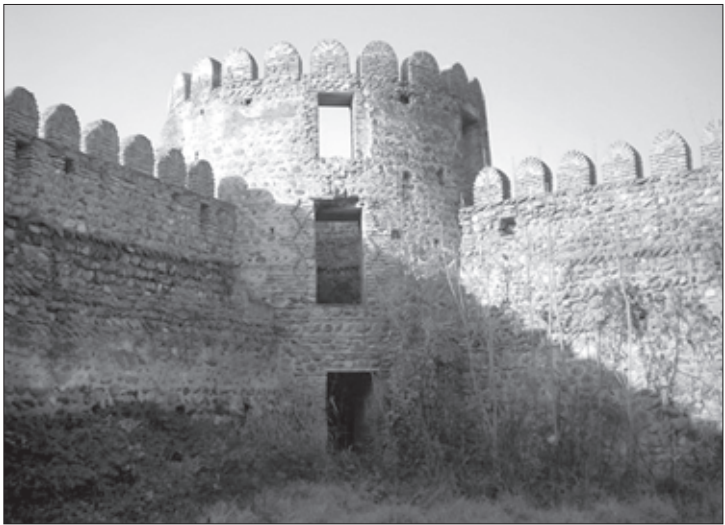
ნურსალ ბეგი გაერთიანებული ჯარით ყვარლის ციხეს შემოადგა

ასეთ ვითარებაში, რასაკვირველია, ყვარლის ციხისთვის ბრძოლამ თეიმურაზ-ერეკლესათვის უდიდესი სტრატეგიული მნიშვნელობა მიიღო, პაპუნას სიტყვით, თუ ისინი ამ ციხეს აიღებდნენ, მაშინ მათ გაღმა-მხარიც დარჩებოდათ, მთელ კახეთსაც ადვილად დაიპყრობდნენ და დასუსტებული ქართლისაკენაც ვერაფრით ვერ შეამარტებდნენ. ამის გამო იყო, რომ თეიმურაზ-ერეკლემ თითქმის ტოტალური მობილიზაცია გამოაცხადეს და ამასთან, სათანადო ჯილდოებიც კი დაანესეს (მათ შორის საკომლო მამულის გაცემა, სათარხნის მიცემა და სხვ.). პაპუნა წერს: მეფეებმა „იარალის ამღები აღარავინ დაადო შინა გლეხი, თორემ თავადი და აზნაურთაგანი ვინ დააკლდებოდაო. ერეკლემ თავისი იშვიათი სამხედრო მოხერხებულობით ყვარელთან ბრწყინვალე გამარჯვებას მიაღწია და ამით ნურსალბეგს ხელი ააღებინა თავდაპირველ განზრახვაზე. ყვარლის ციხის ბრძოლა, თავისი მნიშვნელობის გამო, „ასნლიანი ლეკური ომის“ პირობებში, თამამად შეიძლება მივიჩნიოთ ერთგვარ მარტყოფად თუ ბახტრიონად.