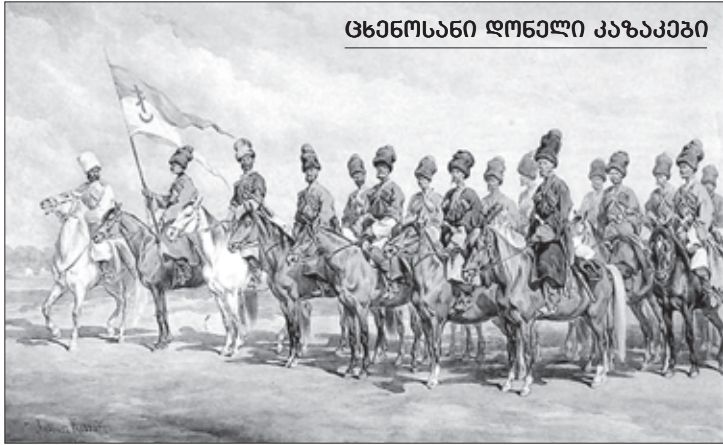
ცხენოსანი ღონელი კაზაკები

ქართველოს სამხედრო გზაზე ძარცვავდნენ მგზავრებს“. ქართველ უფლისწულთა მიერ ნაქეზებულნი (რომლებიც იმერეთში იმყოფებოდნენ) დარწმუნებული იყვნენ, რომ რუსული ჯარები, რომლებიც ამჟამად საქართველოში იდგა, მალე დაუბრუნდებოდა კავკასიის ხაზს. ეს თავდასხმები რომ აღეკვეთა, გენერალმა ი. პ. ლაზარევმა ითხოვა მათ წინააღმდეგ ძალის გამოყენება.