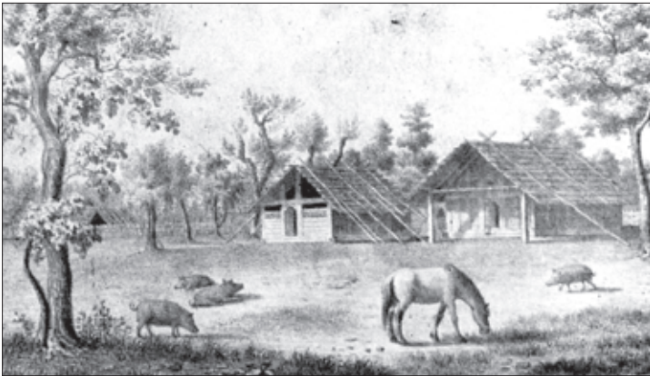
დიუბუა დე მონარჟს ნახატი „გლახის კარ-მიღამო იმერეთში“

მაგრამ, როგორც აღვნიშნეთ, განსაკუთრებით სავალალო იყო მდგომარეობა იმერეთში . იქ არაჩვეულებრივმა წყალდიდობამ და უამრავმა თავგმა გაანადგურა მთელი მოსავალი. ამას გარდა, წყალმა ბევრ ადგილას წაიღო საცხოვრებელი სახლები და დაარჩო დიდძალი პირუტყ-