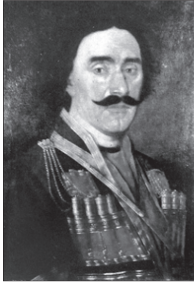
იმაერთის მეფე სოლომონ I

ამავე დროს სოლომონ მეფე დამხმარე ძალას დასავლეთ საქართველოს გარეთაც ეძებდა. 1758 წელს ლეკთა დიდი ჯარის უცვარი შემოსევისას თეიმურაზ-ერეკლემ დავით ქსნის ერისთავი გაგზავნეს იმერეთს და სოლომონ მეფეს დახმარება სთხოვეს. სოლომონმა სწრაფად მოაშველა ლაშქარი. ცოტა ხნის შემდეგ თვითონაც გადმოვიდა. „ნახა მეფენი გორს. დახვდნენ საყვარლად და გაისტუმრეს ისევ მიცემითა და შერიგდნენ პირითა მტკიცით; რომელსაც