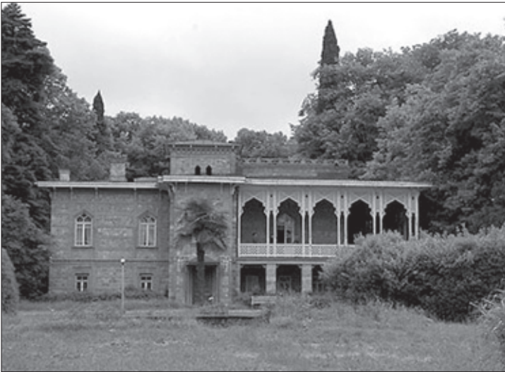
ჭავჭავაძეთა სასახლე წინანდალში

უცებ ვილაცამ ხელზე ძლიერ მომქაჩა. კნეინას მიტოვება არ მენადა, მაგრამ ტყვე ქალს ხომ არ შემეძლო, ჩემს ნებაზე ვყოფილიყავი და მაშინვე საკუთარ ადგილს მივაშურე. ამის შემდეგ ჩემ თვალწინ დატრიალდა სისხლიანი ტრაგედია, რამაც მთელი სხეული ამითრთოლა: კნეინას ახლოს გაიმართა საშინელი შეტაკება. თუმცა ქალბატონი ოდნავადაც არ შერხეულა, რათა მოსალოდნელი საფრთხე აეცილებინა. შეტაკება კი მისი მითვისების მიზნით მოხდა. მტაცებელთაგან ბევრი ხვდებოდა, რომ კნეინა ძვირფასი ნადავლი უნდა ყოფილიყო და მის გამო ერთი მეორეს გააფთრებით უტყვევდა. ბოლოს და ბოლოს ჩხუბი დასრულდა და კნეინა, ჩემს მსგავსად, ერთ-ერთ მეპატრონეს მიეკუთვნა, რომელიც დაიხარა და ჰკითხა: