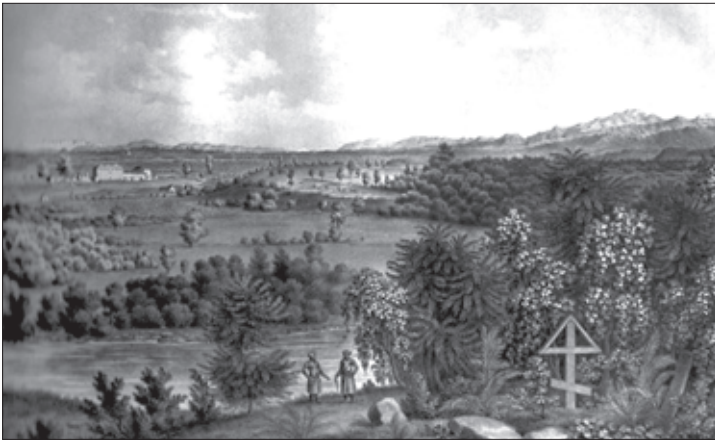
ოზურბეთი, 1830 წ. დიუბუას ნახატი

ამასთანავე უნდა აღინიშნოს ის ფაქტიც, რომ ამ ოქმებიდან მტკიცდება, თუ რა სასტიკი იყო ხალხის განა-