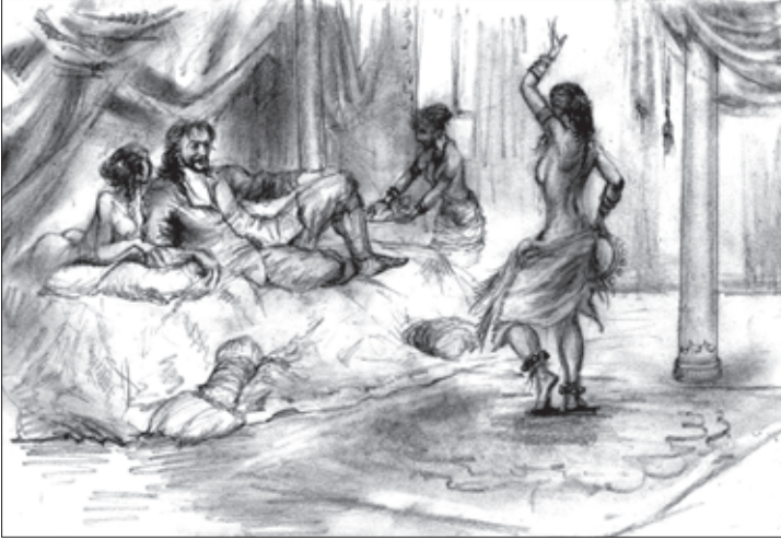
„ჰარეში“ — ნ. კიკელიძის ნახატი

ვი მკითხველი გაიჩინა, ალბათ, იმიტომ, რომ ყველა აღუწერელი ამბავი სინამდვილეა და ჰარამხანის საიდუმლოებას ეხება, ავტორმა თავისი ვინაობა დაუმალა საზოგადოებას, რათა საკუთარი თავიცა და სხვებიც ხიფათისაგან გადაერჩინა. ეგებ ქალების სახელები და გვარებიც გამოგონილი იყოს სხვადასხვა მოსაზრების გამო. მაგრამ ერთი რამ ცხადია, აქ მოთხრობილი ამბავი ჭეშმარიტებაა. ჰარამ არაბულად ნიშნავს ხელშეუხებელს, წმინდას. ჰარამხანა მაჰმადიანების სახლის იმ ნაწილს ეწოდება, სადაც მამაკაცებისაგან განცალკევებით ცხოვრობენ ქალები. მუსლიმანების შეხედულებით, ხელისუფლების არც ერთ წარმომადგენელს, სასულიერო პირი იქნება ის თუ საერო, არც გარეშე მამაკაცებს, შინაურებსაც კი, გარდა სახლის პატრონისა და მისი შვილებისა, ნება არ აქვთ, ჰარამხანის ზღურბლს გადააბიჯონ. გამონაკლისი არიან სულთანი და შაჰი. აღმოსავლეთში გავრცელებული თვალსაზრისით, სამეფო ტახტის მფლობელის ჰარამხანაში შესვლა ბედნიერების სანინდარია.