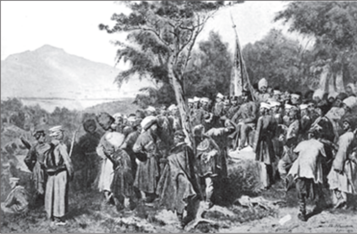
შამილის ტყვედ ჩაპარდნა

ვედრას. იმამმა აქ მიიღო ყველა სტუმარი და შემოიარა კალუგის უფროსები, მაგრამ დროთა განმავლობაში სალამოებს უფრო ხშირად შინ მარტოობაში ატარებდა. დღითიღე მას უფრო და უფრო ენატრებოდა თავისი ოჯახი. ბოლოს და ბოლოს დადგა დღე შამილის ნათესავებთან შეხვედრისა. მისი ოჯახი კალუგაში ჩამოსვლისას 22 სულისაგან შედგებოდა, მათ შორის იყვნენ მოსამსახურეებიც. მალე შამილი ოჯახთან ერთად კიევში გადასახლდა, ხოლო 1870 წელს მას უფლება მიეცა, მექაში გამგზავრებულიყო.