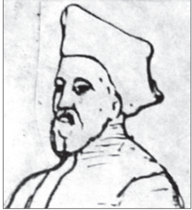
კრისტოფორო დე კასტელი

იტალიელი მისიონერი, პატრი, თეატინელთა ორდენის წევრი. მოღვაწეობდა XVII საუკუნის პირველ ნახევარსა და შუა წლებში. საქართველოში 1628 წელს ჩამოვიდა პატრანტონიო ჯარდინასა და ბერ კლაუდიოსთან ერთად. მისიონერები მივიდნენ ქალაქ გორში თეიმურაზ პირველთან, ხოლო 1634 წელს შემოქმედელი ეპისკოპოსის — მაქსიმე მაჭუტაძის მიწვევით გურიაში გადავიდნენ. 1640 წელს ვახტანგ II გურიელმა ისინი განდევნა. იტალიელი მისიონერები ოდიშში ჩავიდნენ. კრისტოფორო კასტელი 1652 წელსაც საქართველოშია, შემდეგ კი იტალიაში ბრუნდება. ამ პერიოდში მან მრავალი საინტერესო ჩანახატი გააკეთა, რომელიც ორ ალბომში იყო შესრულებული, ერთი ალბომი კრისტოფოროს იტალიაში დაბრუნებისას განადგურდა, მეორე კი დაცულია ქალაქ პალერმოს კომუნალურ ბიბლიოთეკაში და 500-ზე მეტ ჩანახატს შეიცავს. ამ ჩანახატების ნაწილი გამოაქვეყნა მიხეილ თამარაშვილმა, მანვე ჩამოიტანა საქართველოში ჩანახატების ნაწილის ფოტოფირები. 1977 წელს კასტელის ალბომი წინასიტყვაობითა და შენიშვნებით გამოსცა ბ. გიორგაძემ. კასტელის რედაქცია, ჩანახატები და მათზე მინაწერები ძვირფას ცნობებს იძლევა XVII საუკუნის საქართველოს პოლიტიკური და ეკონომიკური ისტორიისათვის.