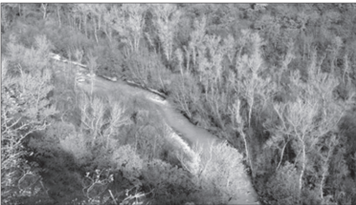
მდინარე ივრის ხეობა

მანსურის მეთაურობით გაჩაღებულმა მოძრაობამ საფრთხე შეუქმნა რუსეთის გეგმებს ამიერკავკასიაში. ამ გარემოებამ უარყოფითი გავლენა იქონია საქართველოს მდგომარეობაზე. ოსმალეთის აგენტმა ომარ-ხანმა საქართველოში დიდი ლაშქრობისათვის უაღრესად ხელსაყრელი დრო შეარჩია; შეიხ მანსურმა წინა კავკასიაში რუსთა ჯარების დიდი ნაწილი ბრძოლაში ჩაითრია, ხოლო რუსეთ-საქართველოსადმი მტრულად განწყობილი პოლიტიკური ერთეულები, ოსმალეთის სახსრებით თუ სხვა დაპირებებით გამხნეებულები, იარაღს ისხამდნენ. 1785 წ. დაღესტნელები ახალციხის ფაშას სწერდნენ, რომ მალე ომარ-ხანი დიდძალი ჯარით საქართველოს შეესეოდა, მაგრამ ფაშა მის მხარეზე თითქოს აშკარად გამოსვლას ვერ ბედავდა, რადგან ეშინოდა, რომ ერეკლე გამარჯვე-