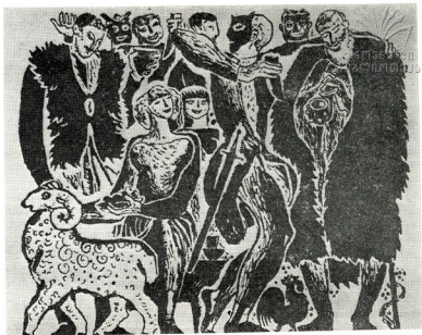
გ. იჩიაური. ბერიკაობა.